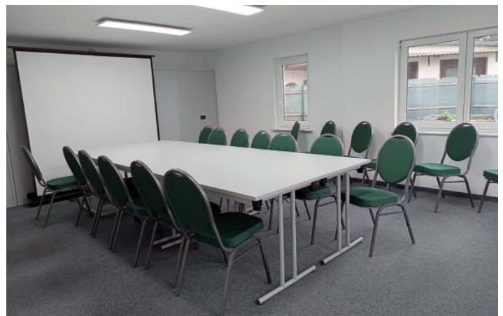
Der schmucke Beratungsraum steht den KGV und auch allen anderen Vereinen offen, womit das Ehrenamt in Spremberg insgesamt gestärkt wird.