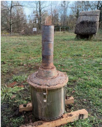
Die Pflanzenkohle wird in diesem Pyrolyseofen „Marke Eigenbau“ hergestellt und danach mit Nährstoffen angereichert.