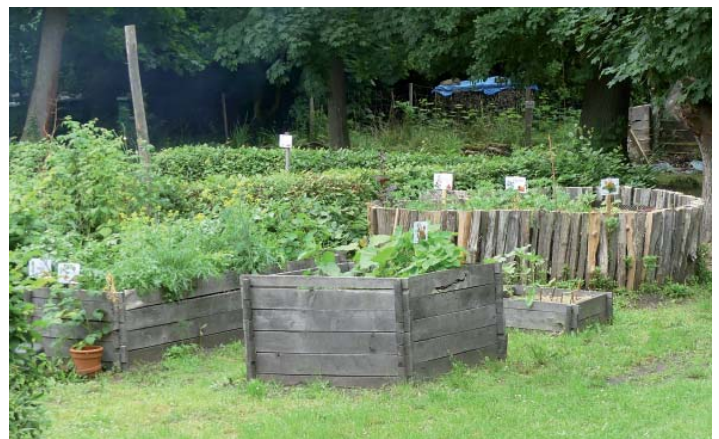
Dabei kommen die verschiedenen Gemüse von den Hochbeeten in den Topf, und so mancher lernt erstmals alte Arten wie den Mangold kennen.