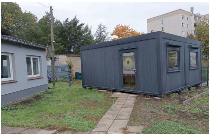
Links ist die sanierte Gartenlaube zu sehen, in der sich der Beratungsraum befindet. Das Umfeld wird im Jahresverlauf 2026 weiter verschönert.

Deshalb hatte die Mitgliederversammlung des BV bereits 2021 eine zweckgebundene Umlage für den Umbau und Anbau des bisherigen Vereinssitzes in Höhe von 30 Euro pro verpachteter Parzelle beschlossen. Parallel dazu wurde gemäß der Förderrichtlinie für das Kleingartenwesen ein Antrag auf den höchstmöglichen Förderbetrag von 30.000 Euro gestellt und schließlich bewilligt. Aufgrund des erheblichen Sanierungsstaus an der Laube haben sich die Gartenfreunde letztlich für eine Containerlösung als Verbandsbüro entschieden. Der Doppelcontainer wurde auf Punktfundamente gestellt. Da der Verwaltungssitz aber im Überschwemmungsgebiet der Spree liegt,