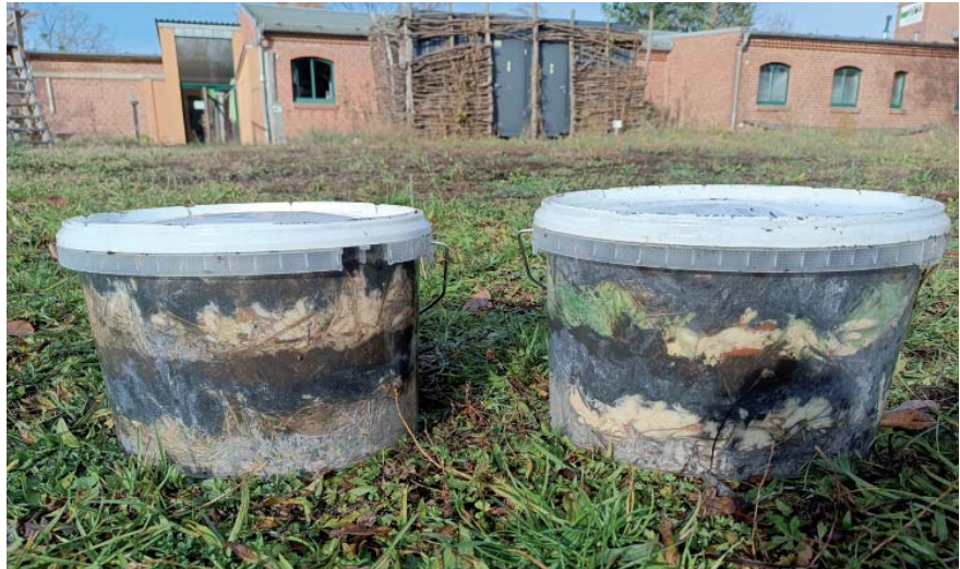
Die Fermentationsbehälter werden mit Küchenabfällen, Essensresten, Grasschnitt und Schafsmist sowie mit Pflanzenkohle gefüllt, als Gärstarter dient selbst hergestellter Kefir. Nach neun Wochen ist die Fermentation erfolgreich abgeschlossen.

Landesverband entwickelt Zusammenarbeit mit dem atz Welzow: