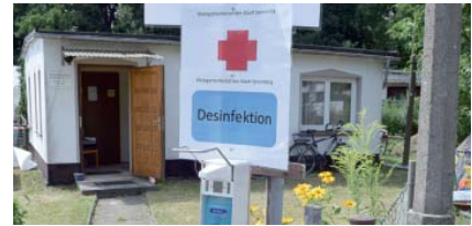
Die alte Geschäftsstelle des Bezirksverbandes Spremberg war in dieser Gartenlaube untergebracht. Auf dem Areal wurden jetzt auch Pkw-Stellplätze eingerichtet (Seite 9).

der Förderrichtlinie für das Kleingartenwesen im Land Brandenburg hätten wir wohl zehn Jahre oder mehr gebraucht, um uns gute Arbeitsbedingungen einschließlich moderner Büroausstattung zu schaffen – ganz abgesehen davon, ob dies angesichts der Inflationsrate dann überhaupt noch realisierbar gewesen wäre.“ In diesem Zusammenhang bedanken sich die Spremberger auch an dieser Stelle ausdrücklich bei den Mitarbeitern der Bewilligungsstelle für die gute Beratung und unkomplizierte Abwicklung der Beantragung der Fördergelder und deren Abrechnung. Großer Dank gebührt auch der Stadt Spremberg für die unkomplizierte Erteilung der Baugenehmigung. Schon als Kai-Uwe Reipert vor acht Jahren seine ehrenamtliche Tätigkeit im Bezirksverband aufgenommen hatte, erkannte er, dass das vorhandene Domizil in der maroden Gartenlaube und ihre Büroeinrichtung aus DDR-Zeiten nicht zukunftsfähig sein und auf potenzielle Bewerber für