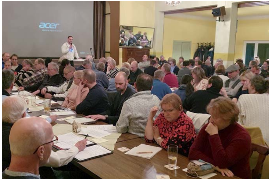
Die Rekordbeteiligung von 108 der 112 Mitgliedsvereine an der Außerordentlichen Mitgliederversammlung des VGS-Kreisverbandes verdeutlichte den Ernst der Lage.

Um eine drohende Insolvenz und unkalkulierbare Mehrkosten abzuwenden, stimmten die Mitglieder mit überwältigender Mehrheit für drei