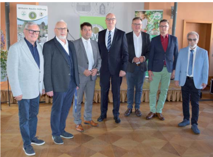
Vertreter beider Landesverbände arbeiten eng in der Wilhelm-Naulin-Stiftung wie 2025 beim Festakt in Brandenburg/Havel zusammen.