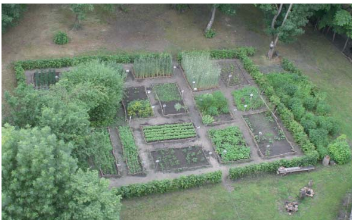
Der Kräuter- und Epochengarten des atz Welzow aus der Vogelperspektive. Regelmäßig wird bei Workshops mit dem frischen Erntegut gekocht.

Themen sein wie die Führungen durch den Kräuter- und Epochengarten, Seminare zum prähistorischen Kochen und „Die kleine Wildkräuterküche“ (18. April) sowie „Die Kraft der Wildkräuter“ (8. Mai). Am 9. April wird zum ersten Workshop zur Herstellung von Terra Preta eingeladen. Bereits am 6. März öffnet die Sonderausstellung „Neu ist nur das Wort: Globalisierung von Nutzpflanzen von der Vorgeschichte bis zur Neuzeit“ ihre Pforten. „Mit unserem nicht nur deutschlandweit einzigartigen Ansatz unterbreiten wir verschiedenen Alters- und Interessengruppen vom Schüler bis zum Rentner spezifische Bildungsan-