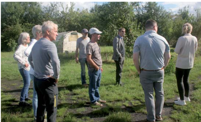
Bei Rundgängen durch die KGA „Lenzener Chaussee“ zur Einhaltung von Sicherheit und Ordnung werden Probleme erkannt und Lösungen erörtert.

tausch. Dazu laden die Gartenfreunde auch ehemalige Beamte ein, die sich über neueste Entwicklungen informieren möchten. Dieses Treffen ist inzwischen schon zu einer guten Tradition geworden, alle Beteiligten freuen sich auf das regelmäßige Wiedersehen. Und natürlich gehört zu dieser Zusammenkunft auch ein Rundgang durch die Kleingartenanlage. Über ihre guten Erfahrungen konnten die Vertreter der beiden Wittenberger KGV am 2. Dezember 2025 im Rathaus ihrer Stadt berichten. Das Polizeipräsidium Land Brandenburg hatte im Zuge der Bereisung von Sicherheitspartnerschaften zur kommunalen Kriminalprävention zu einem Erfahrungsaustausch mit allen SiPa-Akteuren eingeladen. Ziel der Beratung am Tisch von Bürgermeister Oliver Hermann war es, neue Erkenntnisse zu gewinnen, die der Optimierung und Entwicklung von Sicherheitspartnerschaften im ganzen Land dienen. Heiko Mundkowski, ps