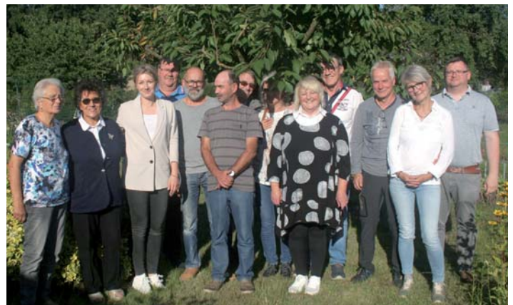
Einmal im Jahr treffen sich die Mitglieder der Sicherheitspartnerschaft im KGV „Lenzener Chaussee“ Wittenberge zum gemütlichen Beisammensein.