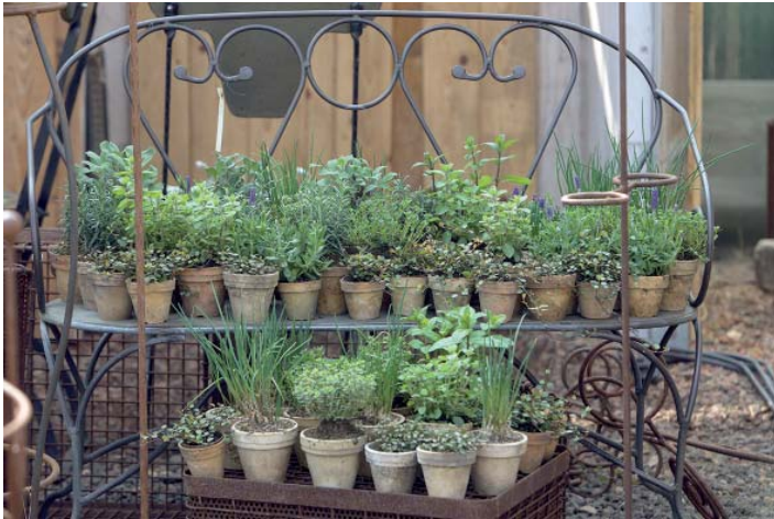
Zu den Kräutertagen halten die Späth'schen Baumschulen für die Interessenten über 450 Sorten an Küchen- und Heilkräutern bereit.