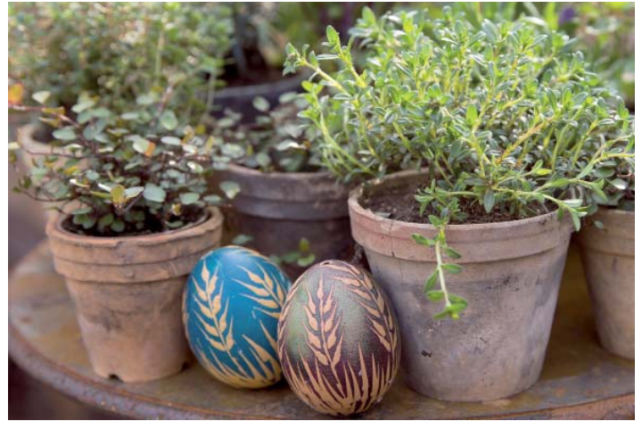
Von den Kräutertagen Ende März wird bei Späth sozusagen gleitend zu den Oster-Feiertagen Anfang April „übergeleitet“...