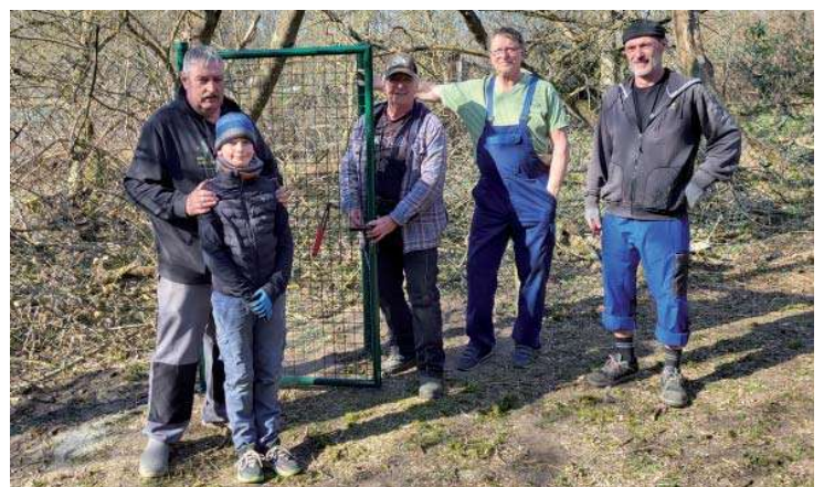
Mit Hilfe von Fördermitteln des Kreisverbandes Brandenburg haben die Gartenfreunde eine Lücke im Außenzaun geschlossen.