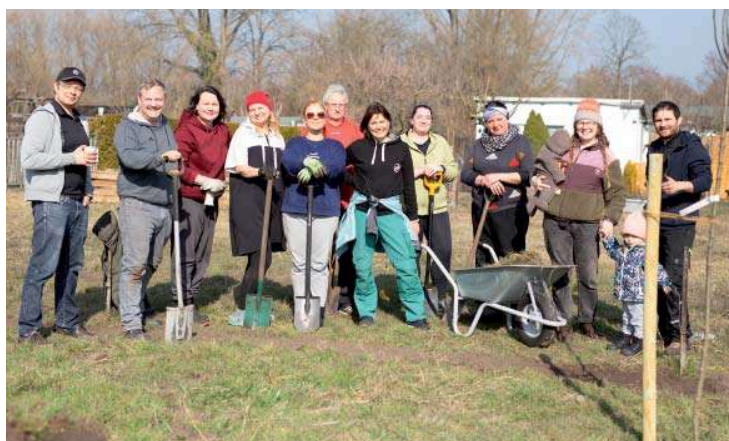
Viele Hände – schnelles Ende. Ein gutes Dutzend Vereinsmitglieder hat mitgeholfen, die künftige Blühwiese anzulegen und das Saatgut auszubringen.